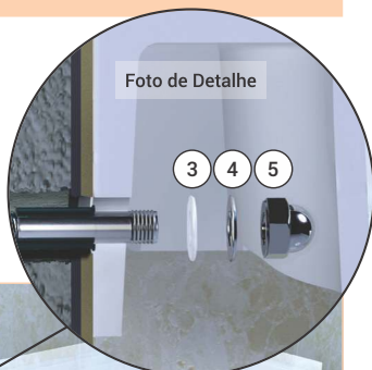
Foto de Detalhe

Insira a bucha (item 1) do seu kit de instalação que acompanha o produto e em seguida insira o parafuso (item 2) deixando 4 cm para fora da parede para a fixação do lavatório.